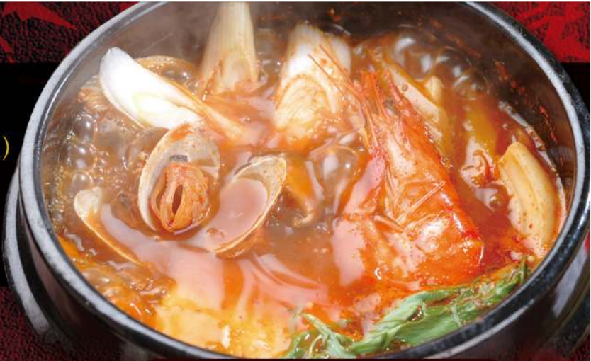
海鮮スンドゥブ 900円

「スンドゥブ (純豆腐)」とは、柔らかい豆腐を使った韓国式鍋料理のことで正確にはスンドゥブチゲと言います。韓国ではチゲを省略して、「スンドゥブ」と称されることが多く、国民的人気のある韓国料理のひとつです。