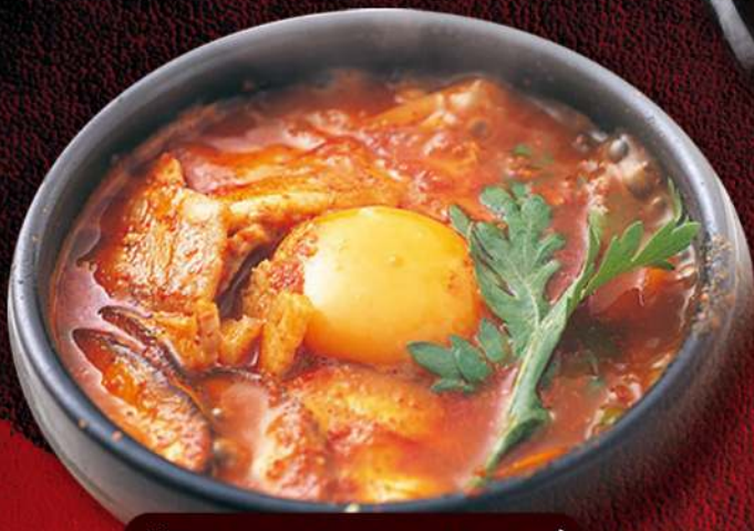
豚キムチスンドゥブ 850円