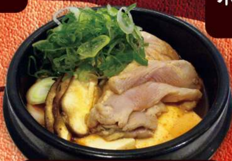
葱と鶏のスンドゥブ 850円