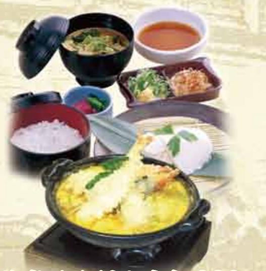
海老天玉子とじ定食 980円