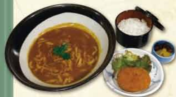
カレーうどん・そば定食