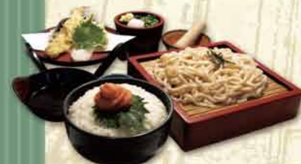
天ざる博多明太丼定食