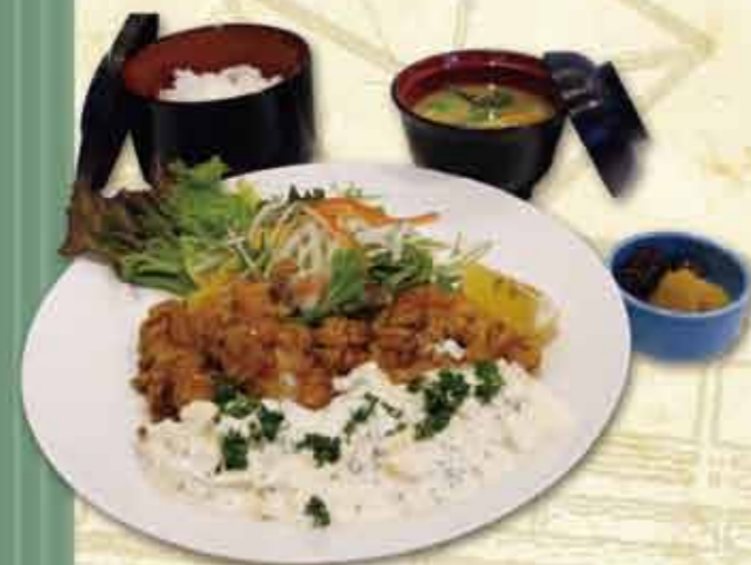
タルタルたっぷり チキン南蛮定食 950円