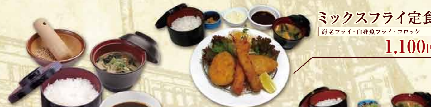
ミックスフライ定食