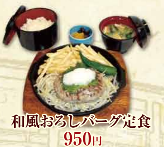
和風おろしバーグ定食 950円