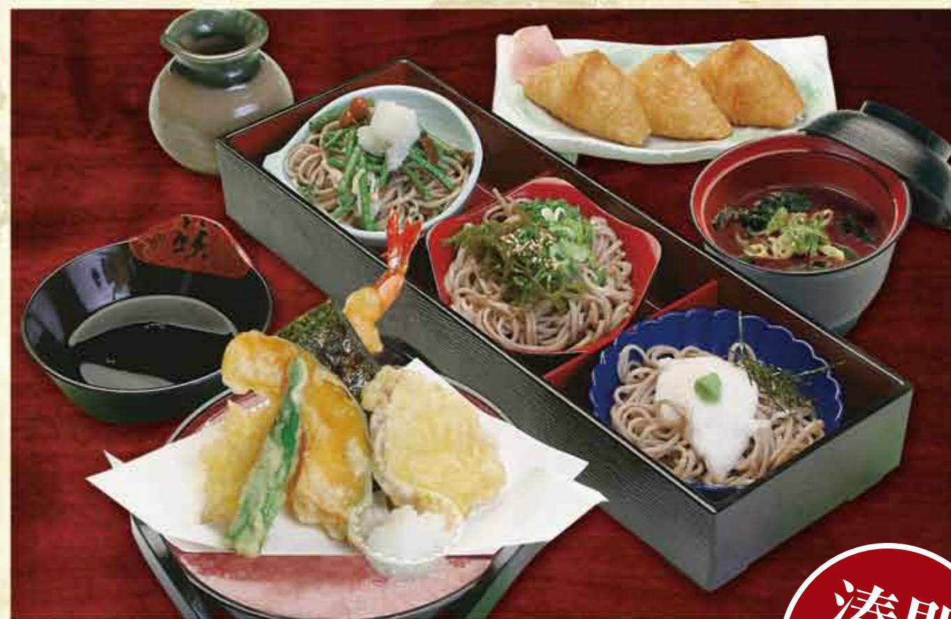
三色おそばセット 950円

湊門人気NO.1!! 山菜、芽かぶ、山芋のトッピングがのったおそばといなり、天婦羅の組合せ。気持もお腹も大満足!